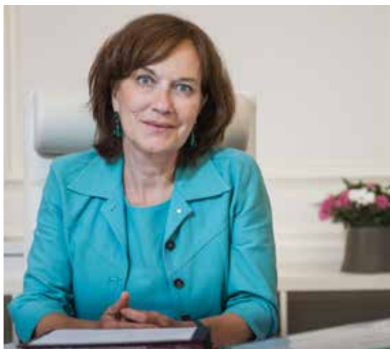
Laurence Rossignol, Ministre des Familles, de l’Enfance et des Droits des Femmes

Les violences faites aux enfants sont encore trop souvent reléguées au rang de “faits divers” ou dissimulées au sein des foyers. Malgré les mises en lumière médiatiques fréquentes, la conscience de la réalité des violences et la capacité à les prendre en compte ne semblent pas progresser dans l’opinion publique. Devant ce constat, le Ministère des Familles, de l’Enfance et des Droits des Femmes a élaboré un plan interministériel inédit, visant à mobiliser la société dans son ensemble, les familles et les professionnel.le.s.